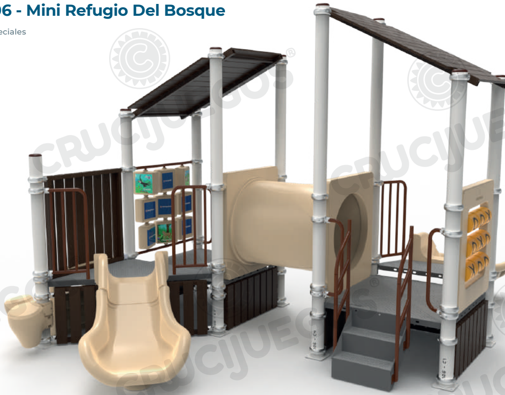
Imagen referencial. Para más información ingrese a www.insumos.crucijuegos.com